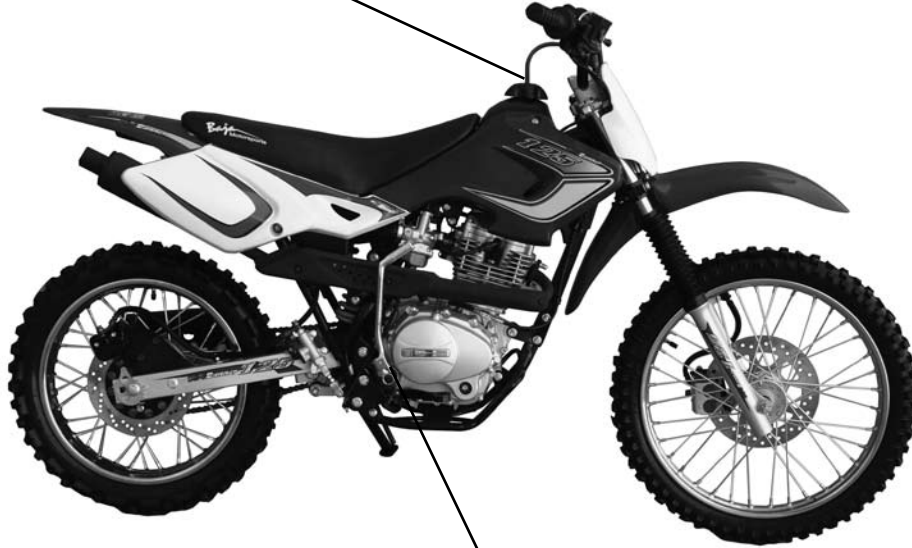
Le bouchon d'huile

8. Remplir le réservoir à essence comme indiqué dans le manuel de l'utilisateur.